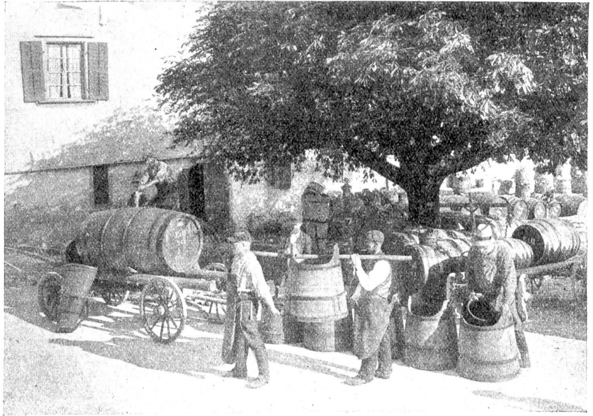
Von der Weinernte am Bielersee. Verladen des neuen Weines.