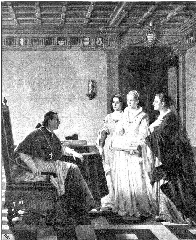
August Weckesser (1874). Die protestantischen Lokarnerinnen vor dem päpstlichen Nuntius. (Museum in St. Gallen.)

Es empörte ihn jeden Morgen, wenn er die Kinder, die blaß und hustend kamen, in dem feustten Haus sitzen sah. Es roch nach Moder und Schimmel und war kellerartig feucht und kalt. Der Ofen heizte schlecht und rauchte. Stürmte es, so fuhren gelbe, lange Wolken den Wänden entlang. Die Kinder husteten auch im Sommer und, so