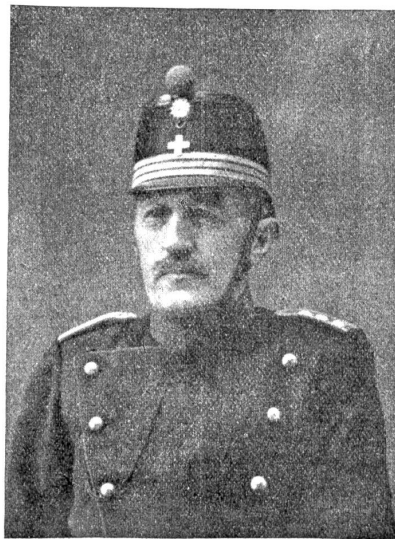
† Oberst Louis Audéoud.

gung der weniger bemittelten Bevölkerung mit Brot, Milch usw. Diesen Passiven stehen allerdings auch ganz erhebliche Einnahmen aus der Kriegsteuer, Kriegsgewinnsteuer, den Ausfuhrbewilligungsgebühren und Ausführorganisationsgebühren gegenüber, deren Ertrag auf Ende September 1917 ungefähr 180 Millionen betragen hat. —