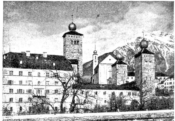
Stockalper-Palais und Jesuitenkirche in Brig.