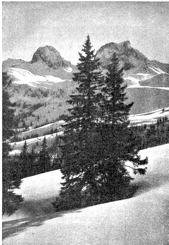
Winterlandschaft aus dem Ganterischgebiet.

die Felsenöde des Gantrischgebietes und die wälder- und dörferrreiche Gegend über und unter dem Gurnigel in ihrer Totalität vorzuzaubern.