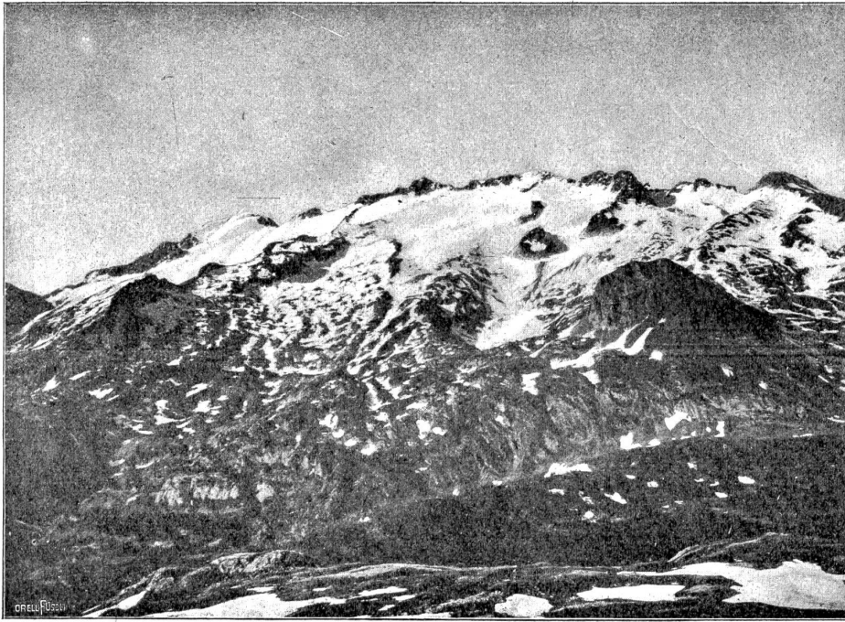
Maladettagruppe mit dem höchsten Gipfel der Pyrenäen (3404 m).

vor. Aber da es sich heute um ihren Namenstag Hulda handle, der unter keinen Umständen ohne Nidelwähe*) vorbeigehen dürfe, so sei es nun eben in einem hingegangen. Sie hatte eine so ausdrucksvolle Art zu reden, daß es für mich eine ganz neuartige Unterhaltung bedeutete, ihr dabei zuzusehen, wie ich denn mit bestem Willen keinen Blick von ihr abzubringen vermochte. Das ganze Gesicht arbeitete beim