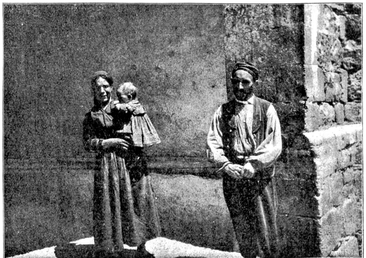
Küsterfamilie im spanischen Pyrenäenstädtchen Bielsa.

„daß der von zu Hause mitgebrachte Proviant, die gedörrten Landjäger und die paar Pfund Käse ihn für einige Tage den Nahrung Sorgen entheben“. Seine Wanderungen