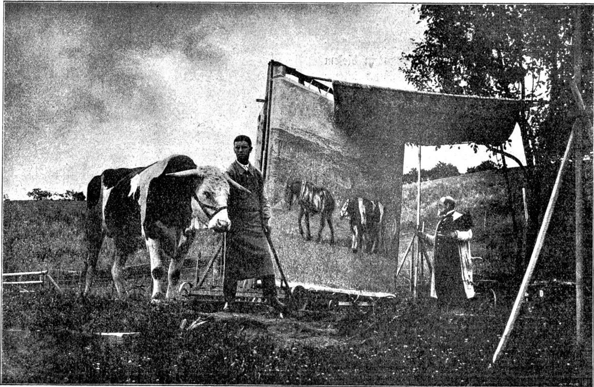
Der Maler Eugène Burnand arbeitet an seinem Gemälde „Le Labour dans le Jorat“.

Diesmal ließ sich die „Patrie Suisse“, unsere lebenswürdige Schwesterzeitschrift in Genf, die Gelegenheit nicht entgehen und ließ sich vom Künstler die Erlaubnis zu einigen Aufnahmen über das neuentstandene Werk geben. Ihr Photograph traf den Maler just bei der Arbeit. Die Situation war reichlich originell und lohnte die Reproduktion. Auch einen Blick ins geräumige Atelier hielt die Kamera fest. Wir geben beide Aufnahmen obenstehend mit den Aufnahmen der „Patrie Suisse“ wieder.