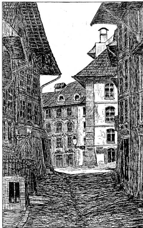
Burgdorf. Rüttschelengasse mit Ausblick auf die Hohengasse.

Federzeichnung von Rudolf Müller, Burgdorf.