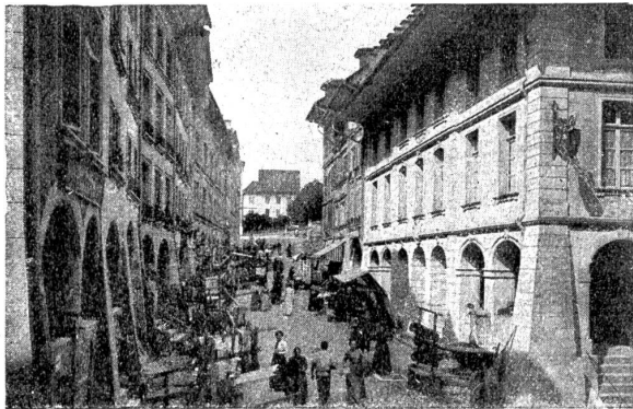
Burgdorf. Das Kirchbühl. Rechts vorn das Stadthaus, in gediegener Berner Art erbaut 1744–1755. Wirkungsvoller Strassenabschluss durch die Stadtschreiberei.

In Biasca fand im Jahre 1773 eine höchst merkwürdige Wolfsjagd statt. Ein Jäger fand in der Nähe