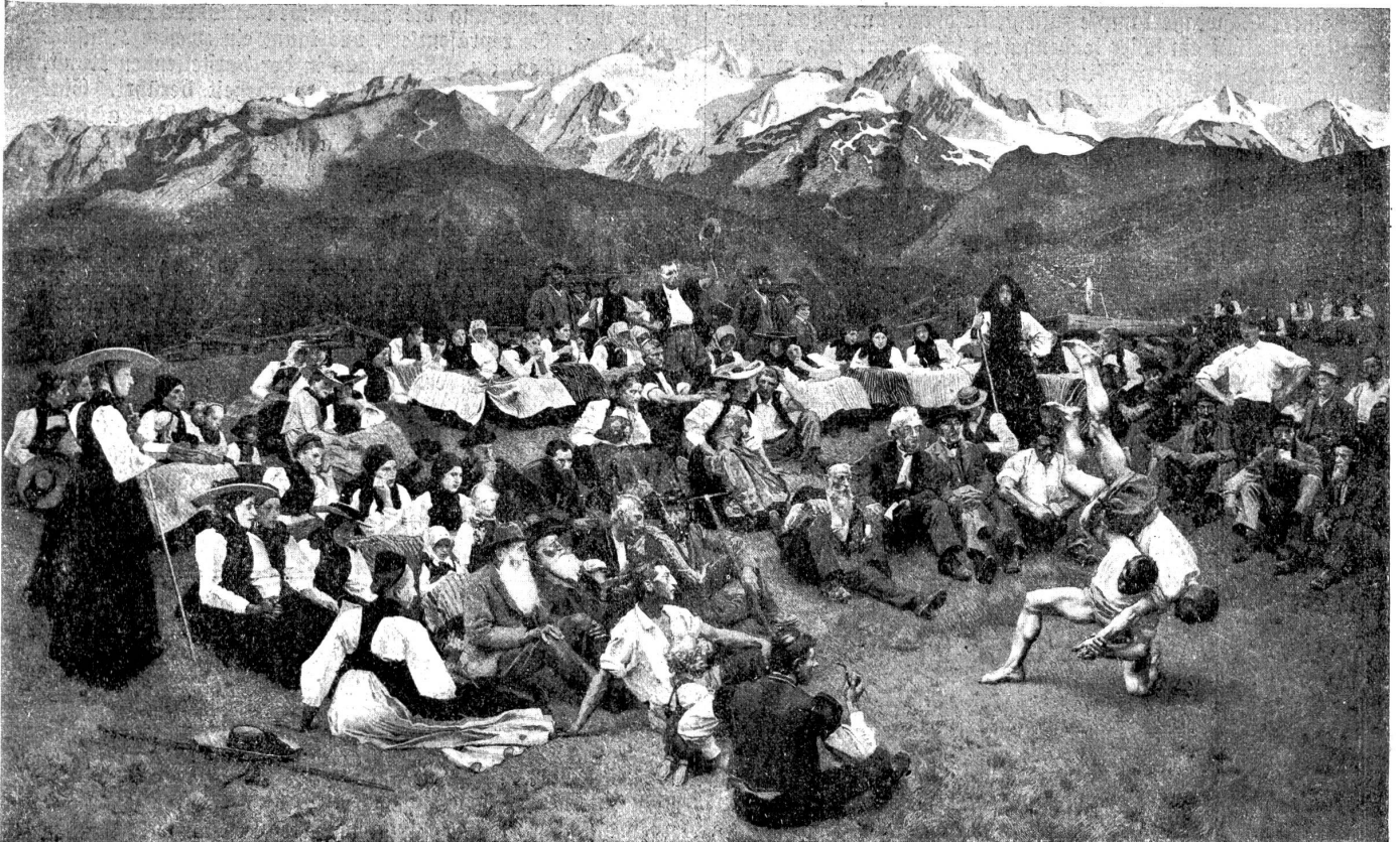
Charles Giron. Die Schwinger.