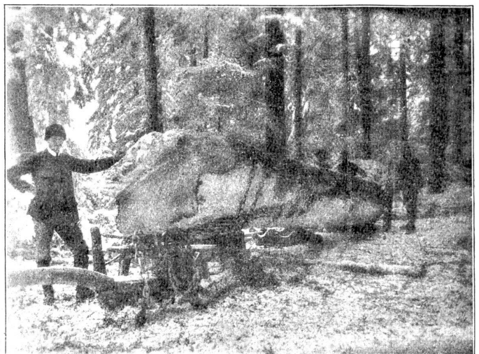
Der grosse Weisstannenträmel, im Walde aufgenommen.

Gerne nennt man den Bauer rückständig, spöttelt wohl über seinen Gang zu allem Althergebrachten. Aber gerade diese mit Unrecht belächelte Rückständigkeit hat etwas Erhaltendes; sie gibt dem Bauer die Stetigkeit in Sitte und Brauch. Wo der Bauer anfängt, diese seine Eigenart zu opfern, wo er aufhört, den Speicher mit Gaben zu füllen, wohl aber die Mittel modernen Verkehrs sich dienstbar macht, und das, was er selbst anbauen könnte, in der Stadt kauft, da spürt der Städter in erster Linie den Wandel der bäuerlichen Eigenart. Solch ein Bauer ist nicht mehr Bauer im guten Sinne des Wortes; er wird zum kalt