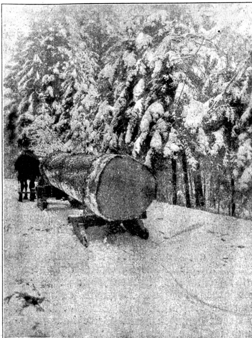
Der zweite Trämel der grossen Weisstanne, im Walde aufgenommen.

Herrliche Wälder geben den stimmungsvollen Rahmen zu dem friedlichen Bilde. Bewundernd schauen wir auf zu den Baumriesen, messen wohl mit weitgespannten Armen ihres Leibes Umfang, erfahrend, daß es oft der Männer mehrere braucht, bis die ausgestreckten Arme sich finden. Wer kennt nicht die Dürs-rütti-Tannen bei Langnau! Auf verhältnismäßig kleinem Raum steht ein halbes Duzend dieser Waldreden beisammen; und welcher Rapfbesucher betrachtet nicht staunend die gewaltige Tanne im Ahornwalde, die links am Straßenrande steht! Da beginnt der Städter zu rechnen und begreift nicht, warum man solchen Reichtum nicht umsetzt in Geld und Gülden. Diese Waldzierden sind des Bauers Stolz, nicht weil sie gewaltige Summen gelten, sondern weil seine eigene Scholle sie hervorgebracht, sein Vater, Großvater und ganze Generationen vor ihm sie gehegt und gepflegt. Ein schöner Zug von Ehrfurcht und Wertschätzung alles dessen, was von den Vorfahren übernommen wurde, äußert sich da und zwar in einer Tiefe und Ausgeprägtheit, die in dieser Form nur solchen Menschen eigen ist, denen die Natur in täglichem Verkehr mehr als ein Rätsel ent- hüllt hat.