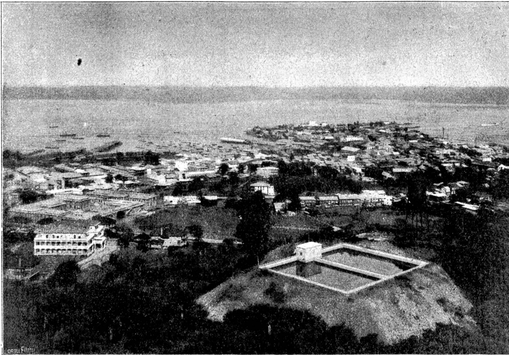
Blick in östlicher Richtung auf die Stadt und Bai von Panama vom nahen „Ancon-Hill“ aus. Im Vordergrund links das bisherige Verwaltungsgebäude der Kanalkommission, rechts neues Beton-Reservoir, zu einem Teil der städtischen Wasserversorgung gehörend. Hinter dem Verwaltungsgebäude die neue Universität von Panama.

gestern dagewesen. Endlich aber setzte sie sich auf einen von den Stühlen, an denen Sepp jahrelang gearbeitet und mit Mühe Farrenkräuter und Mäuschen und Raben in das harte Holz geschnitzt hatte, streckte ihre beweglichen Füße aus und spielte mit dem Eichhörnchen, das sich auf ihre Fußspitze gesetzt hatte. Der alte und der junge Freund fanden beide, daß das Mädchen das zierlichste und lieblichste sei, was sie je gesehen, und es schien ihnen beiden, als hätten die Sonnenstrahlen noch nie so golden auf dem Fußboden der Hütte gezittert.