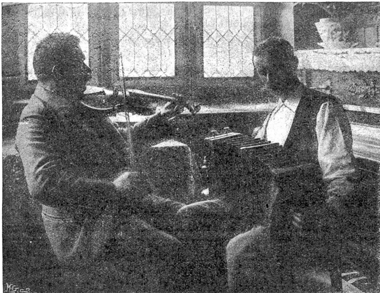
Kammermusik auf dem Lande.

Aus Em. Friedli, „Lügelfisch“, Verlag von A. Francke.