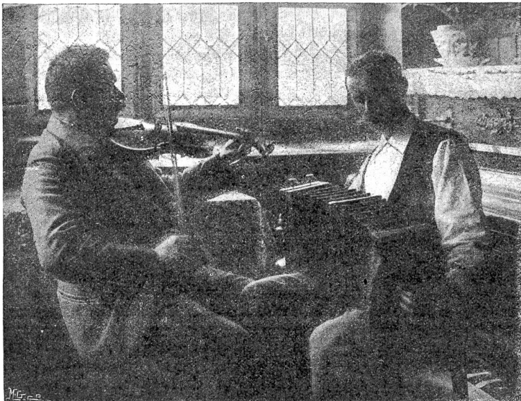
Kammermusik auf dem Lande.

Aus Em. Friedli, „Lügelfisch“, Verlag von A. Francke.