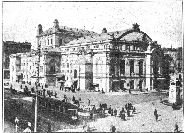
Vor dem Opernhaus in Kiew.

rüstete sich und verfaßte in geheimen Sitzungen Rüstungspläne, die zu Eroberungsplänen werden, sobald sie offensiv gedacht werden — defensiv wären sie sinnlos.