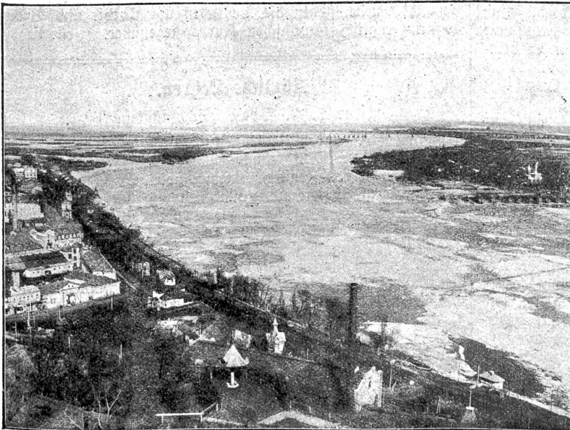
Blick auf die Stadt Kiew und die Ufer des Dnjestr.

Ueber die geheimen Verhandlungen vor der Westoffensive ist unerwartet ein Blicklicht gefallen. Graf Czernin hat in einer Wienerrede behauptet, Clemenceau hätte einige Zeit vor dem Beginn der Schlacht angefragt, unter welchen Bedingungen die Mittelmächte in Friedensunterhandlungen eintreten würden. Als er den Bescheid erhielt, in bezug auf Frankreich gebe es nur ein Friedenshindernis, nämlich seine Ansprüche auf Elsaß-Lothringen, wären die Besprechungen zu Ende gewesen. Die Antwort Clemenceaus auf diese Darstellung war kurz: „Czernin hat gelogen.“ In der Diplomaten-sprache sagt ein solcher Satz nichts. Wenn eine Ware hundert Franken kostet und ich behaupte, sie koste neunundneunzig, dann antwortet ein Clemenceau: „Sie haben gelogen.“ In der nun folgenden Polemik erwies sich, daß Clemenceaus „Anfrage“ erst nach verschiedenen österreichischen Anknüpfungsversuchen erfolgte, daß in der Schweiz, und zwar in Freiburg, seit August 1917 mehrfache Besprechungen stattfanden, bei denen Oesterreich durchaus der einladende Teil war. In Paris behauptet man nachträglich, auf die Besprechungen nur deshalb eingegangen zu sein, weil sie gute Informationsquellen über die innere Lage des Feindes eröffneten. Ferner wäre der österreichische Vertrauensmann, Graf Reverteira,