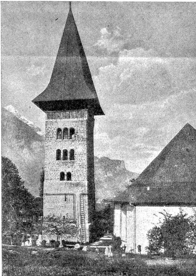
Kirche in Meiringen: freistehender Glockenturm. (Aus der Zeit der 2. Kirche stammend, steckt er fast 7 Meter tief im Boden. Er wurde als Wachturm benutzt und ist genau nach den vier Himmelsrichtungen gestellt, während man die Kirche selbst auf dem Gemäuer und in der Richtung der ersten Anlage weiterbaute. An der Südwand befand sich früher ein Bild des heiligen Christophorus.)

Die Entdeckung war so interessant, daß man sich zu einer regelrechten und kunstgerechten Ausgrabung und Bloßlegung der Räume dieser älteren Kirchen entschloß. Diese erreicht man, indem man auf einer Treppe unter der westlichen Vorlaube der heutigen Kirche fast fünf Meter in die Tiefe steigt. Durch einen längern Gang schreitend, gelangt man zu einer Altarnische, die wohl dem ältesten Kirchlein angehört hat. Die Formen des Bauwerkes deuten auf das 12., wenn nicht sogar auf das 11. Jahrhundert zurück; 800—900 Jahre alt wären also diese Reste des ältesten Baues. Zahlreiche Einzel-funde, wie gläserne Gefäße, ein Weihrauchfaß, das noch Kohlenreste enthielt, etc., gaben den Forschern wertvolle Anhaltspunkte zur Datierung der verschiedenen Bau-perioden.