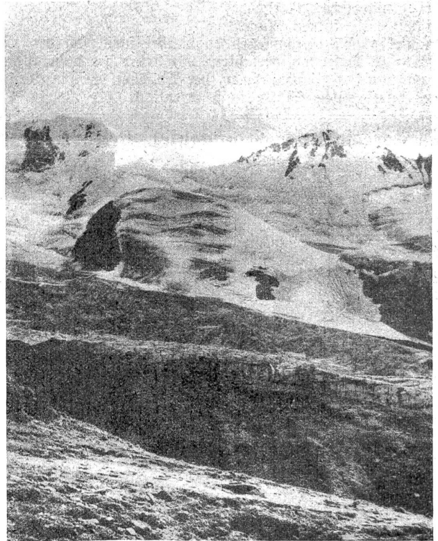
Schrotterhorn und Kreilspitze.

Unsere Bilder zeigen die Verhältnisse, in welcher die Verteidiger der Hochgebirgsfront leben müssen. Das ist die Welt, in welcher österreichisch-ungarische Soldaten ihre Stellungen bauen müssen und in welcher eiserner Wille auch Geschütze, selbst schweren Kalibers, sprechen läßt. Was es bedeutet, eine Kanone oder einen Mörser von der Talsohle bis weit über 3000 Meter hoch hinauf zu schaffen, ist mit Worten kaum zu schildern. Leichter schon ist der Transport von Maschinengewehren und Minen- und Scheinwerfern, obgleich auch er die äußerste Anspannung aller Kraft und die unbedingte Zuversicht für das schließlich Gelingen verlangt. Aber gerade durch diese Außerungen eines harten Charakters haben die österreichisch-ungarischen Soldaten aufs neue ihren Wert, selbst in den schwierigsten Lagen, bewiesen.