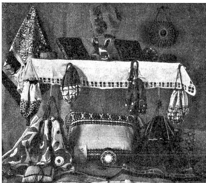
Verkaufsgenossenschaft des SHS: Neuzzeitliche Reiseandenken.

reien herstellt, daß die Spitzenklöppelei in hoher Blüte steht, daß in Langnau und im Heimberg fröhliches