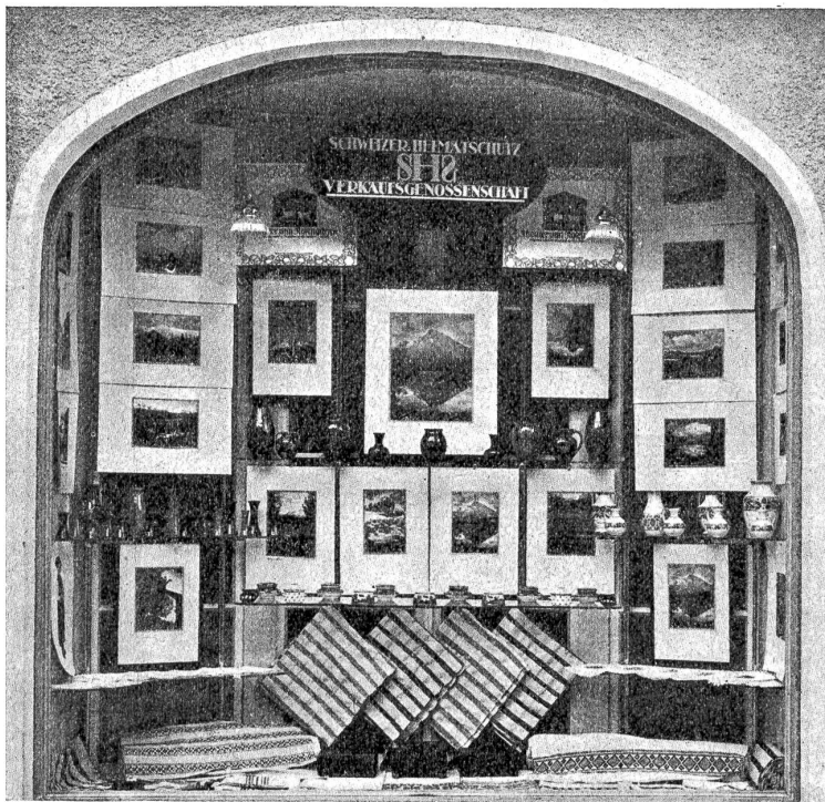
Verkaufsgenossenschaft des SHS: Schaufenster in Arosa.

aus und zieh' dir meine an. So, jetzt wird's dir warm werden. Jetzt sag: weiß denn deine Mutter, daß du von daheim fort bist? Und warum bist du fort? So allein in der bösen Nacht?"