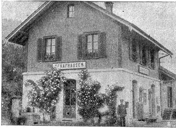
Station Schafhausen (an der Linie Burgdorf-Chun). Eine sonst reizlose Mauer ist mit Rosenspaller und Blumenstöcken anmutig geschmückt. („heimatschus“).

Reihe gelber Blümchen (einjährige stinkende Hoffahrt) und zwischenhinein einige Geranien. Den Schluß bildet in er-