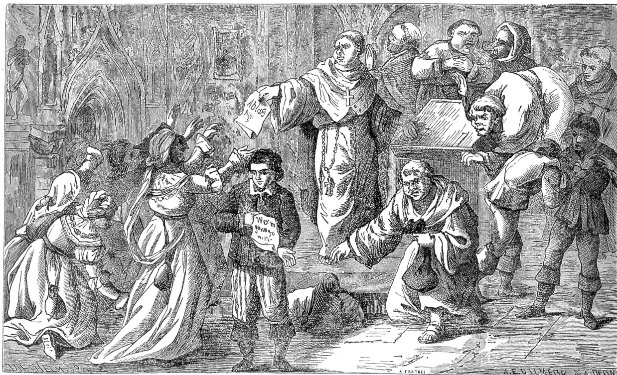
Verkauf von Ablassbriefen. (Zum Artikel „Die Buchdruckerkunst im Dienste der Kirche“.)

„Nein, nein, fürchte nicht, daß ich den Namen nenne! Ich kenne dich ja. Der grelle Tag soll die Dämmerung deiner Phantasie mit keinem Strahl durchbrechen; deine leiblichen Augen sollen sie nie gesehen haben! So seid ihr beide sicher, du in deinem Künftertum und sie in ihrer heiligen Jungfräulichkeit, die du mir übrigens — o rätselhafter Widerspruch des Menschenherzens! — mit fast eigenmächtigem Eifer zu behüten scheinst.“