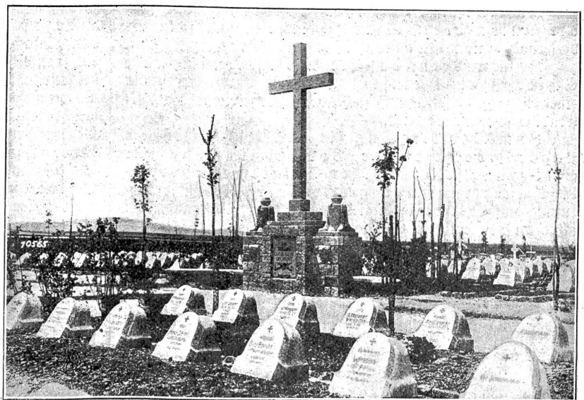
Der neue Kriegerfriedhof in Prilep (Macenonien).

„Nur eines,“ drängte Peter, „Niklas, nur eines! Ein einziges! Und ein Lump, wer mehr trinkt!“ — Sie sahen sich an. In den zwei Augenpaaren fladerte es . . . Eine