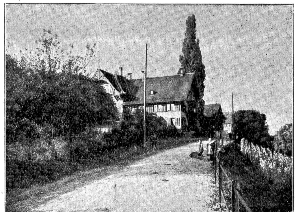
Wohnhaus von Konrad Ferdinand Meyer in Kilchberg.