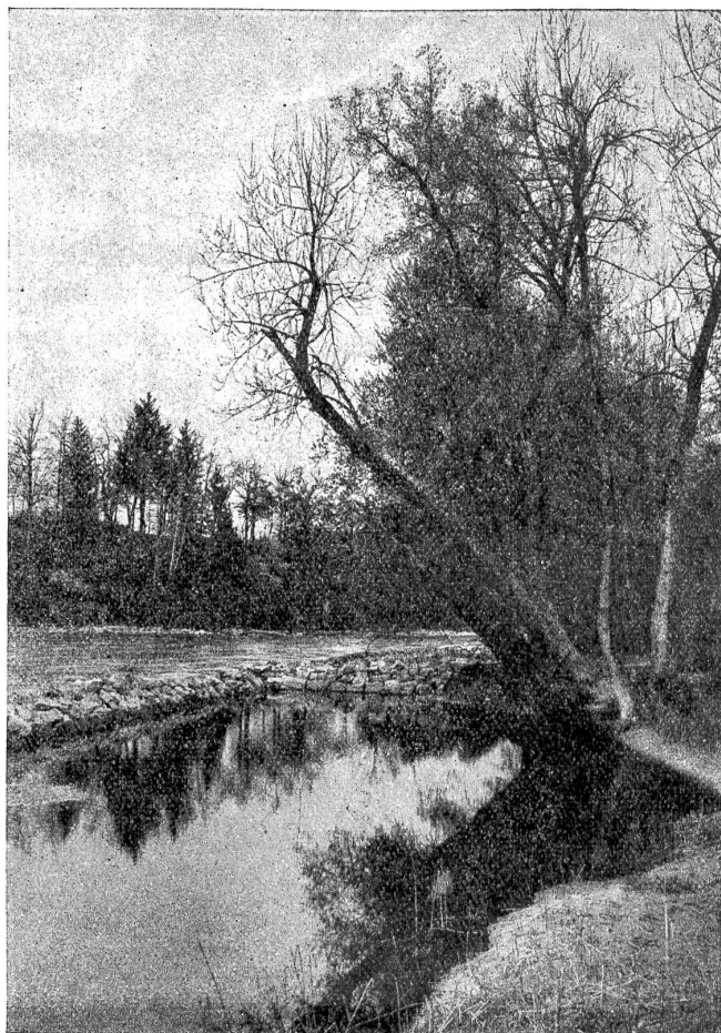
partie an der Elfenau.

Der Staat ließ also die Brückenzölle und Weggelder erhöhen, so sehr, daß man deutlich merkte: Die Summe übertrifft weit die Unterhaltungskosten für Brücken und Wege. Salz- und Pulvermonopol wurden immer drückender. Nun wurde man auch inne, wie schwer das Besoldungssystem für die Amtleute auf dem Lande lastete und wie leichtes Spiel der landvöglichen Willkür gelassen wurde. Der Staat bezog nicht alle Einkünfte zu seinen Händen und bezahlte die Beamten nicht von sich aus. Er überließ ihnen vielmehr einen Teil der Staatseinkünfte: Bußen, Konfiskationen, Gerichtsgebühren, einzelne Zehnten. Es ist freilich wahr, daß den Landvögten, besonders in Bern, scharf auf die Finger gesehen wurde. Trotzdem geschah es, daß einzelne das Regierungsgeschäft möglichst einträglich zu gestalten suchten; so wurden Prozesse provoziert, hie und da auch Bestechungsgelder angenommen. Oft lagen verjährte Forderungen abgetretener Landvögte auf dem Volke. Zu Zeiten der Not fiel dieses Verwaltungssystem unter die allgemeinen Klagen. Das war auch nach dem dreißigjährigen Krieg der Fall.