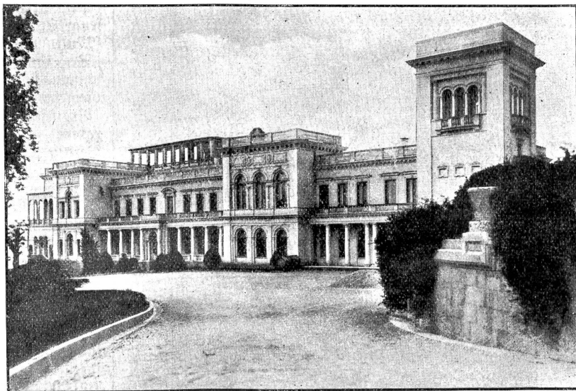
Bild aus der Ukraine: Schloss des ermordeten Zaren in Livadia bei Jalta, das nun von deutschen Truppen bewacht wird. (Vorderansicht des Schlosses.)

Im Anfang des 14. Jahrhunderts waren die Steppen am untern Dnjepr Lummelplatz tatarischer Nomaden; Kiew, einst Zentrum der frühslawischen Kirche, war seit der Zerstörung um 1240 durch die Mongolen eine unbedeutende Grenzstadt geworden.