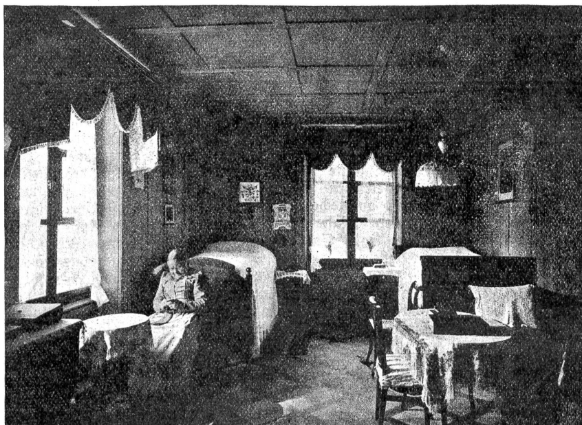
Dienstbotenheim Oeschberg bei Koppigen. Schlafzimmer für weibliche Heiminsassen.