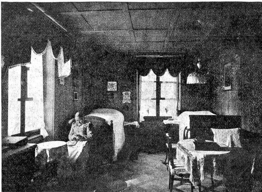
Dienstbotenheim Oeschberg bei Koppigen. Schlafzimmer für weibliche Heiminsassen.