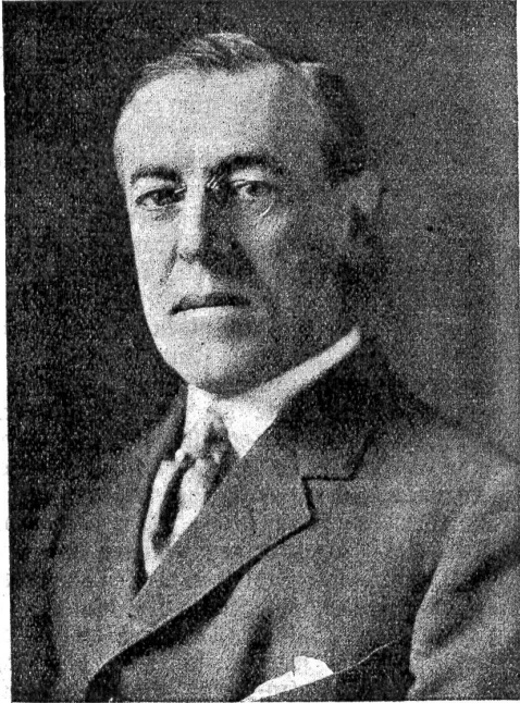
Woodrow Wilson, Präsident der Vereinigten Staaten von Amerika.

tärischen Ratgeber der Alliierten einladen, Deutschland Bedingungen bekanntzugeben, die die Alliierten in den Stand stellen, die Einzelheiten des Friedens durchzusetzen.“ Das