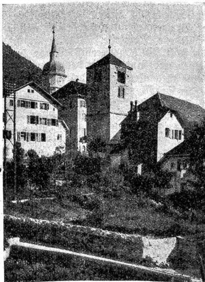
St. Immer (Bezirk Courtelary).

Von oben herab gesehen erinnert dieses Land an ein Feld, das mit einem Handpflug tief aufgewühlt wurde und dessen Furchen sich verhärteten, um nachher wieder aufzubrechen. Auf den ersten Anblick erscheint es einformig und melancholisch: es fehlen ihm Farbe und