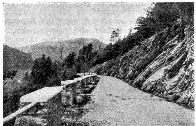
Die Kahlstrasse bei Laufen (Berner Jura).

Es gibt sehr wenig unberührte Städte in der Schweiz: Estavayer, die alten Viertel von Freiburg, Murten, Stein am Rhein und Sankt Ursitz. Und dennoch: in diesen Flecken mehr noch als in den Alpen, an den Ufern der Seen oder in der Einsamkeit der Wälder ist es, wo ich unter der Erde und unterm Stein das hundertjährige Herz unseres Landes schlagen höre. Sie sind die lebenden Zeugen von allem, was unsere Väter liebten, suchten, schufen, litten und wünsch-