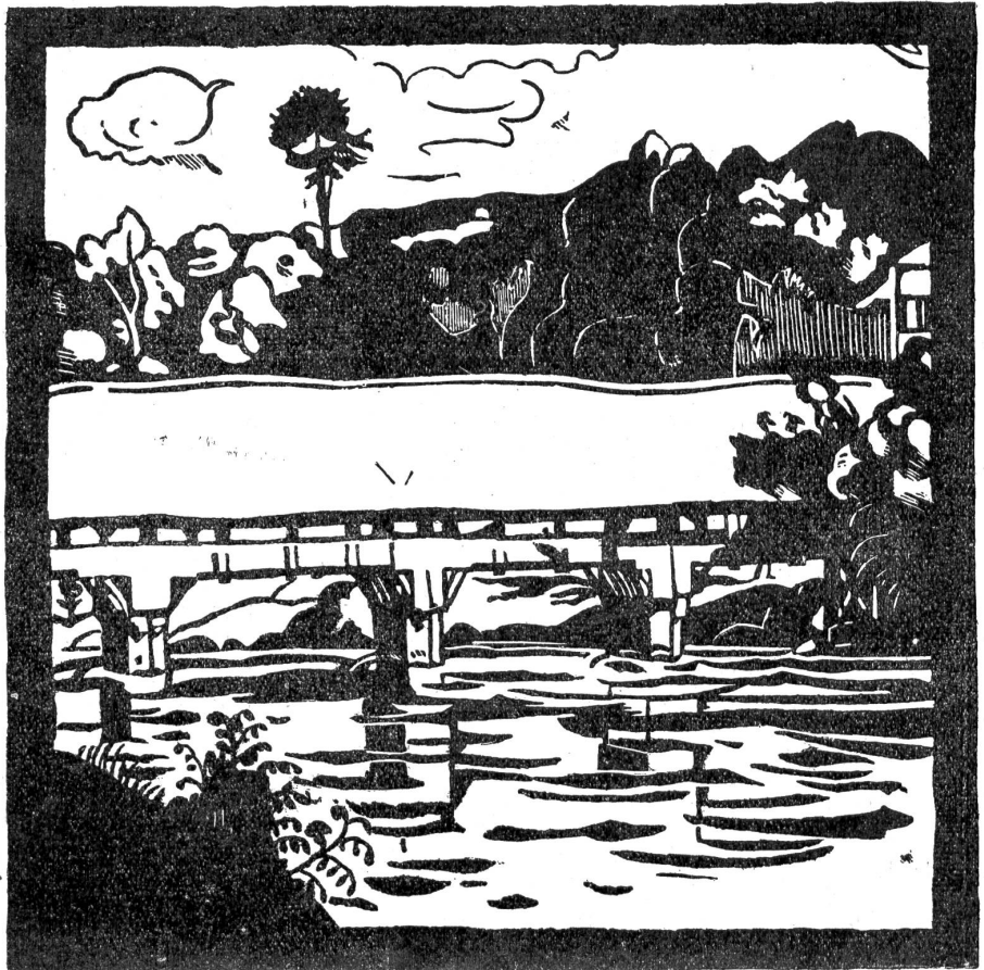
Gottfried Christen, Bern: Reubrücke (Holzschnitt).

Der Draußen aber stieß nun ein langes, trauervolles Stöhnen aus, worauf Uli mit ähnlichen Seufzern zu antworten begann.