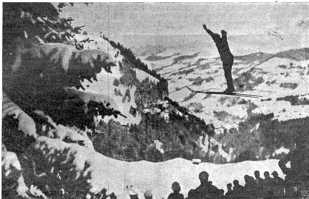
Ein kühner Skisprung beim Skifahren in Adelboden.

Flammenzungen loderten die Bergspitzen in den reinen Himmel empor. „Zuhui“ — Ganz zu oberst auf der Schüpfenfluh jauchzte einer der Unsrigen; Fauchzer und Gesang widerhallten in allen Flühen — Rasch, wie es gekommen, erlosch das Goldlicht auf Felsen und Firnen, und die Berge sanken starr und entseelt zurück in die Dämmerung. Das Nebeltuch über den Tälern war wieder bleich und kalt und aus dem öden farblosen Meer erklangen fern und dunkel die Sylvesterglocken — so erlebte ich das schöne und feierliche Sterben des alten Jahres — lange lauschte ich dem Geläute der unsichtbaren weißen Kirchen des Uchtlandes . . . Der Feldruf unserer Gilde weckte mich aus meinem Sinnen. Am Schwarzenbühl tauchte eine lange Karawane von Skiläufern auf. Das