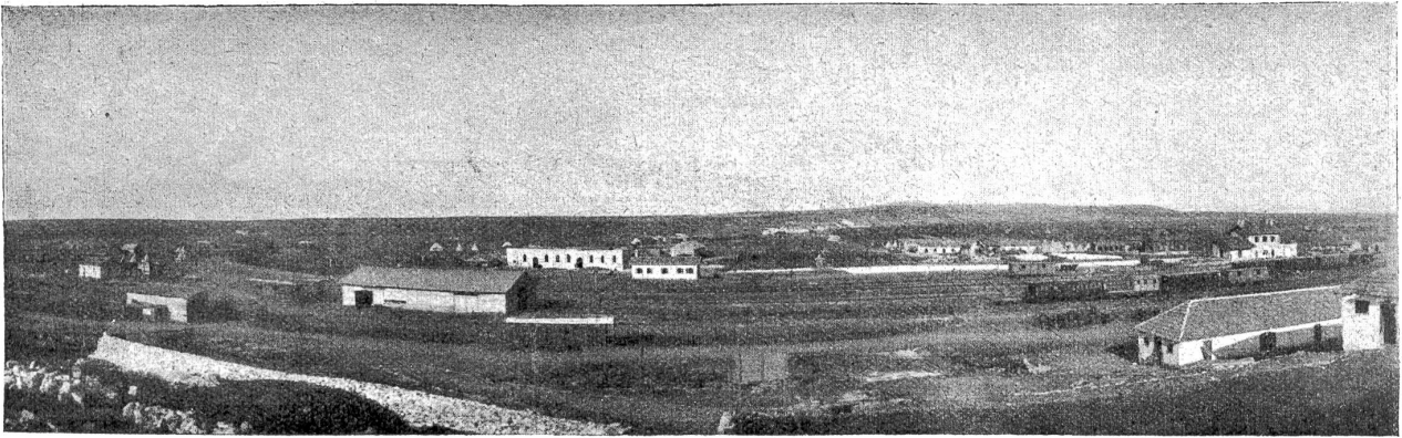
An der Eisenbahnlinie Gaza-Beersheba-Jerusalem-Damaskus.

und eine Assimilation nicht möglich ist — ihr Judentum reiner erhalten als die Juden in Westeuropa. Während die Westjuden das Hebräische verlernt haben, sprechen sie noch die Sprache Jakobs, allerdings ein schlechtes Hebräisch, das Yiddisch. Aber als ein rechtloses Einsprengsel in einem fremden Staatswesen kann ihr Hebräertum sich nicht entwickeln; es möchte leben und kann nicht und möchte sterben und kann auch nicht. Auch kulturell trägt das Volk den Fluch des ewigen Juden. Ihr höchster Lebenswunsch ist, in heiliger Erde zu ruhen; aber nur wenigen ist es vergönnt, ihre letzten Lebenstage in Jerusalem am Fuße der Davidsburg zu verbringen. Weil dieser starke Glaube meist auch mit der größten Armut gepaart ist, wohnen im Judenquartier zu Jerusalem auch die ärmsten Menschen der Welt. (Schluß folgt.)