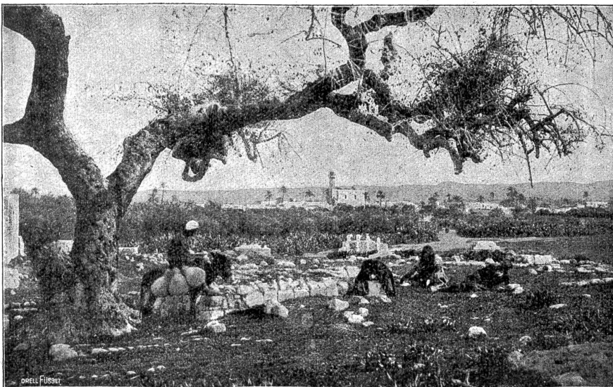
Lydda in der Philistebene, am Wege Jaffa-Jerusalem.

Die Ostjuden haben natürlicherweise — eben weil sie politisch entrechtet sind