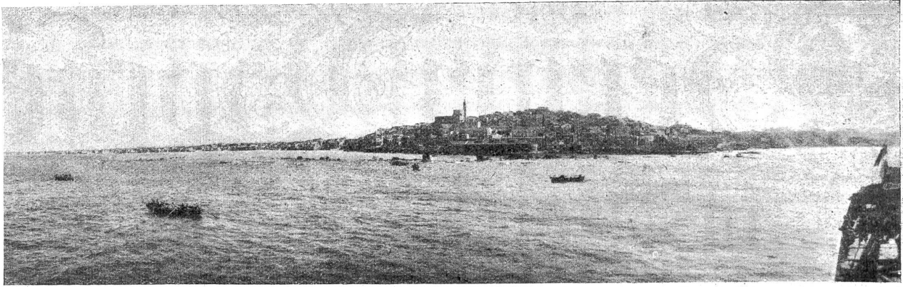
Jaffa in Palästina, vom Meer aus gesehen.