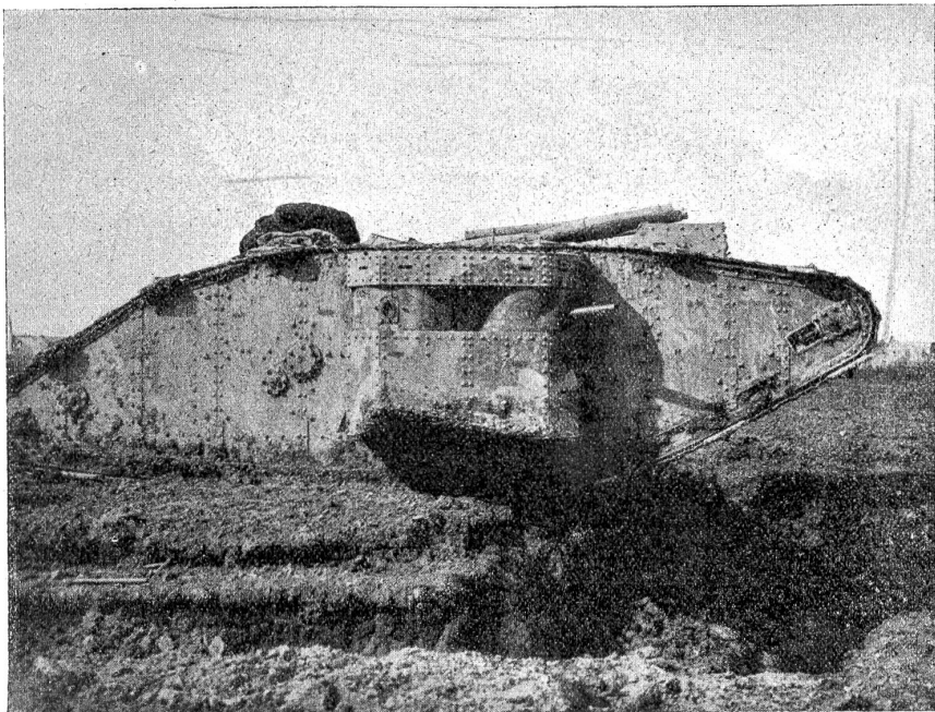
Ein englischer Tank (Panzer-Kraftwagen), einen Schützengraben überschreitend.

ob Kurland, Polen und die Ukraine russisch seien oder nicht. Aber maximalistisch sollen sie sein, dazu aber auch Deutschland und Amerika! Nie gab es einen größern Glauben unter der Sonne, als diese prinzipienfesten Marxisten ihn besitzen: Den Glauben an die Solidarität der Massen Deutschlands mit jenen Rußlands, und das, nachdem ein Riesenkrieg die beiden Völker jahrelang gegeneinander schleuderte. Es offenbart sich aber hierin auch der Gedanke der unbewaffneten Neutralität, wie ihn die Internationale in den kleinen europäischen Staaten vertritt und praktisch ausführen möchte: