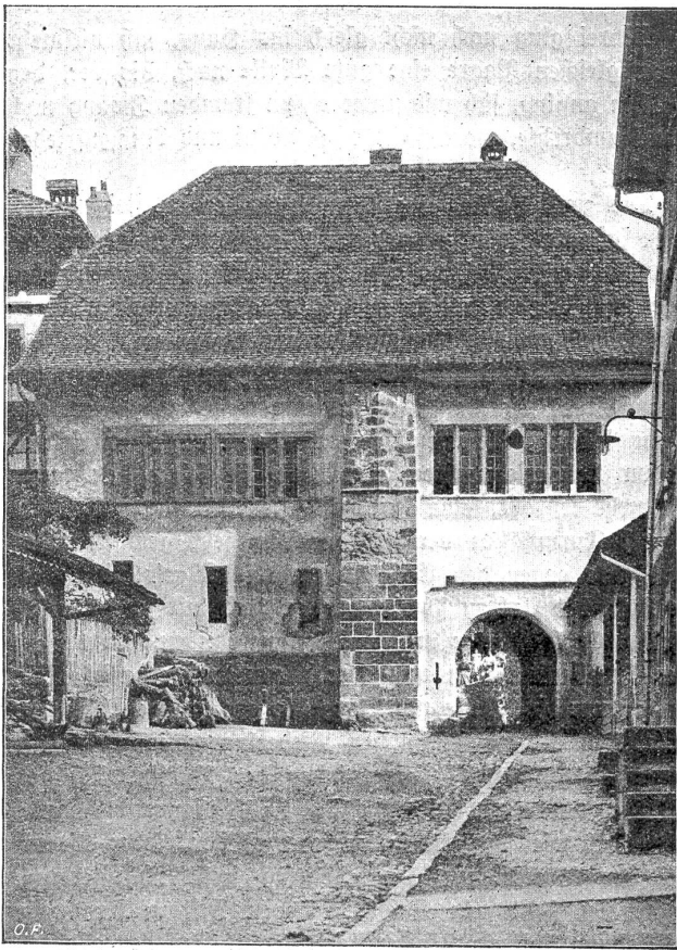
Erlach, das Rathaus, Südanicht.

den Tüden von Haß und Reue, die er sich droben im Wald solange mit Axt und Säge vom Leib zu halten vermochte! Die stärkeren Gefühle des Eroberers, der Ueberwindung aller Hindernisse entbehrten der Standhaftigkeit in dieser gehekten, brünstigen Seele, die so oft schon lahm und wund von ihren Höhenflügen zurückkehrte. Auch jetzt hatte er nur noch ein Bedürfnis: sich, wie's gerade kam, einzuspinnen in jegliches Behagen seines Alltags, seiner nächsten Umgebung. So war Heinrich Anderegg. Leicht begeistert, schnell verzagt — ein Held im Morgenrot, ein Bettler oder Brigant im Abendgraun.