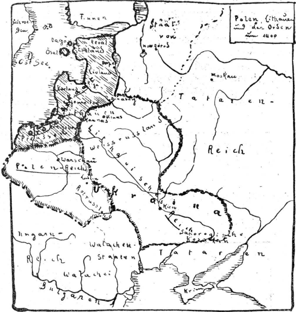
Polen, Litaunien und der Orden um 1400.

Völker nie. Alle andern acht Gruppen erfüllten eine Zeitlang die Welt mit ihrem Lärm. Die neunte allein sieht eingekleidet zwischen Slaven, Germanen — (Deutsche, Polen, Russen) — und Finnen und scheint unterzugehen . . . .