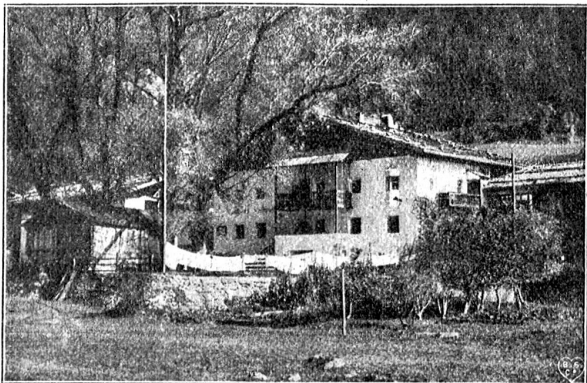
Das Sandwirts Haus Andreas Hofers Geburtshaus.

Mit solch unheilbarem Tirolerheimweh im Herzen sah ich einmal weit fort von daheim auf der sonnigen Veranda eines Strandhotels. Es war in Sydney in Australien. Ich sah über das Meer hinaus und dachte an die Heimat.