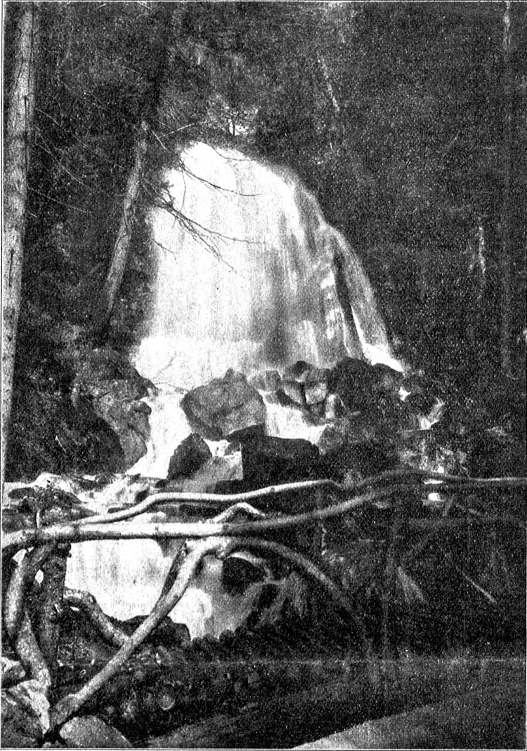
Die Parkanlagen vor der Beatushöhle: Der mittlere Wasserfall.

jähriger mit einer Magd. Die jüngeren Brüder standen hinter einer Scheiterbeige und schauten grinsend zu. Drinnen wurde der Lärm immer toller, bis er abgab und verlief. Müde trollte sich nach Hause, wer noch gehen konnte. Die anderen blieben liegen, wo sie gerade lagen und schliefen schnarchend ein.