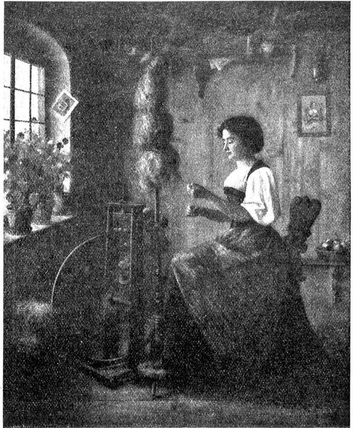
Rudolf Tschan: Die Spinnerin.

(Im Besitze von Soc. G. Zimmstein, Bern.)