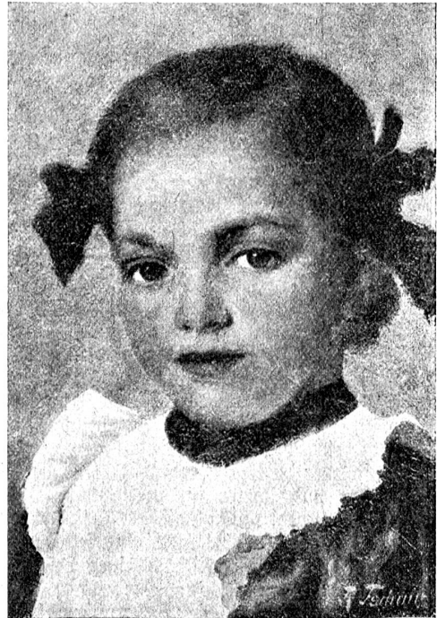
Rudolf Tschan: Mädchenbildnis.