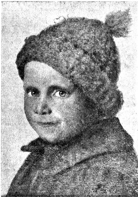
Rudolf Tschan: Knabenbildnis.

(Im Verlage von Soc. & Zimmstein, Bern.)