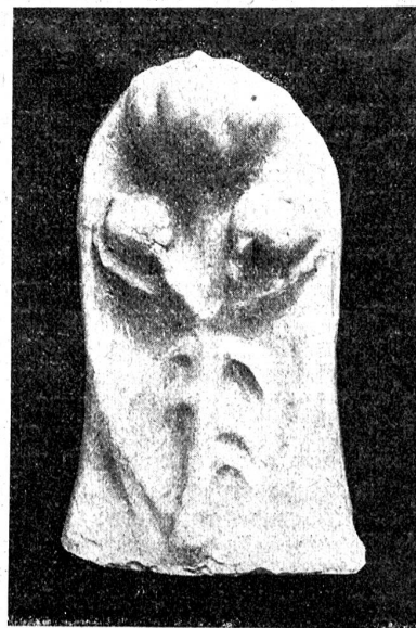
Paul Bay, Beatenberg: Pflanzenstudie in Gips.

daten, die an der Grippe starben. Ein Sockel, auf seiner Vorderseite ein Schwert, oben ein Helm, alles ganz einfach. Doch des Sockels Linien sind geschwellt wie ein Mantel, worunter Lebendiges sich regt; das Schwert ist wie ein Kreuz