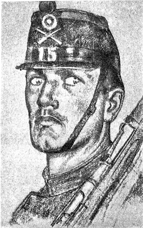
Charles L'Eplattenier: Soldatenbild.

wollte der Heuerin am Morgen den Lohn geben und dann sogleich nach Meningen hinauffahren; meine Frau konnte