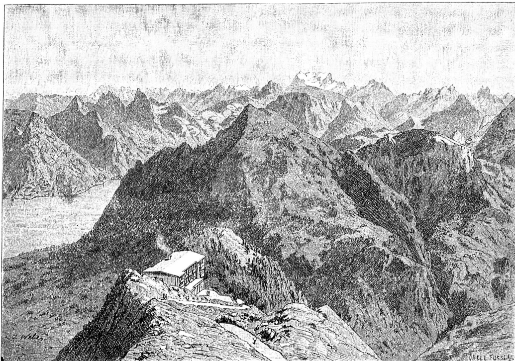
Stanserhorn: Aussicht gegen Osten: Glarner- und Schwyzer-Alpen.

Die d'Albon erhob sich, ihre Nasenflügel zitterten, aber sie sprach nicht. Unter der Türe traf sie auf de la Haie und schritt mit einer unglaublich hochmütigen Gebärde an ihr vorüber, der ihr mit einer leichten Verbeugung den Weg freigab.