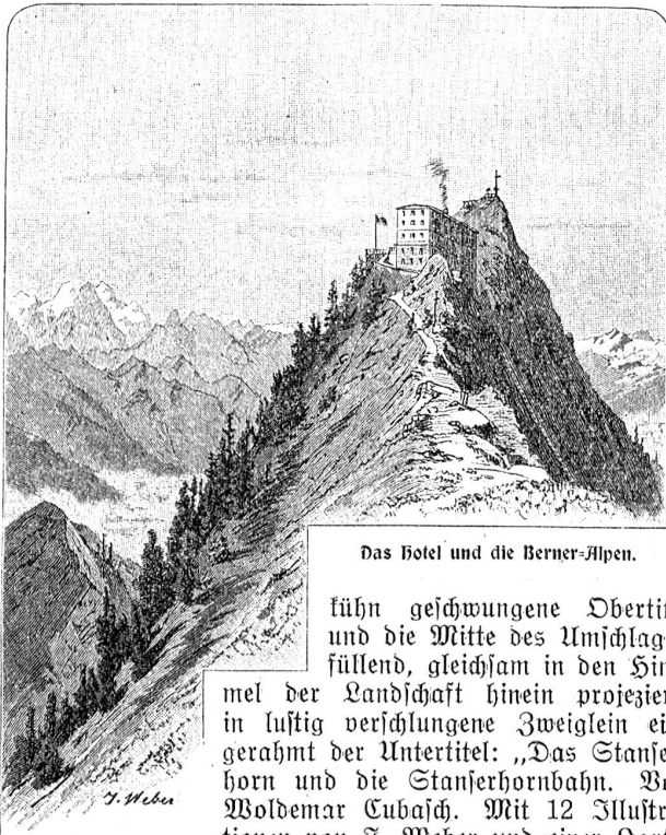
Das Hotel und die Berner-Alpen.

kühn geschwungene Obertitel und die Mitte des Umschlages füllend, gleichsam in den Himmel der Landschaft hinein projiziert, in lustig verschlungene Zweiglein eingerahmt der Untertitel: „Das Stanserhorn und die Stanserhornbahn. Von Woldemar Cubasch. Mit 12 Illustrationen von J. Weber und einer Karte.