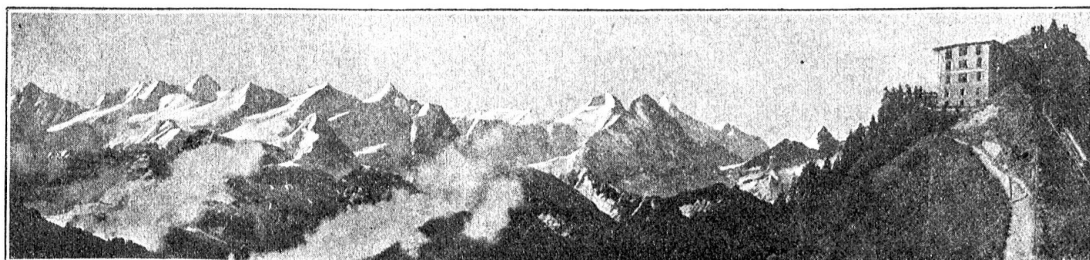
Die Berner-Alpen vom Stanserhorn aus.