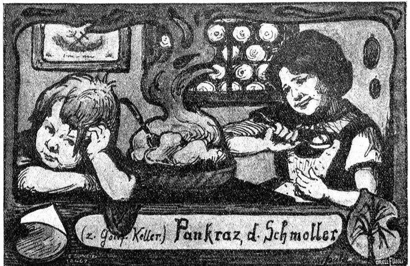
Dora Hauth: Pankraz, der Schmoller.

Im Zimmer des Herzogs von Burgund saß die Dauphine am Totenbette. Kerzen auf silbernen Kandelabern standen am Boden und streckten ihre dünnen, weißen Wachsstäbe hoch auf, über denen der Flamme tulpenhafte Schönheit schwebte. Neben der Gattin, deren Gesicht in verborgenem Schmerz zuckte, verharrte der fromme Gemahl, die Hände gefaltet, in leisem Gespräch mit dem Beichtvater. Die Dauphine verwandte keinen Blick vom Antlitz des toten Sohnes. Sie grübelte über das nach, was ihn in den letzten Augenblicken seines Lebens beschäftigt haben könnte und was wie ein zur Lösung forderndes Rätsel in seinen elfenbeinbleichen Zügen stand. Sie sah auf die geschlossenen Lider, die durchsichtige, von den schwarzen Lockenringeln noch umrieselte Stirn, auf die knapp und gerade wie ein Schnitt geschlossenen Lippen. Es war, als lebten hinter der Stirn noch Gedanken, die im Verwehen waren, als hielt der Mund ein Wort zurück. Hatte das tapfere Kind einmal