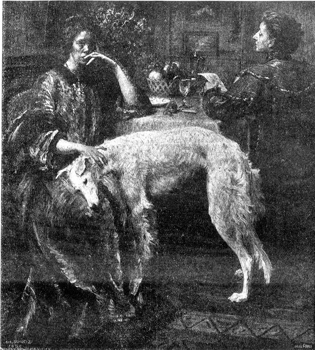
Louise Breslau, Paris: Beschaulichkeit.

du noch, Josias, und weißt doch, daß des Kirchenältesten Tochter Hochzeit hält! Da will es sich schiden, daß auch des Pastors Sohn mit der Braut ein Tänzchen mache!“ Dann hub sie meinen Rock vom Nagel, bürstete ihn säuberlich und steckte mir einen Hochzeitstaler in die Taschen. Und icht vernahm ich auch von fern das Fiedeln und Trompeten, und währete es nicht lang, so war ich mitten in der Hochzeit.