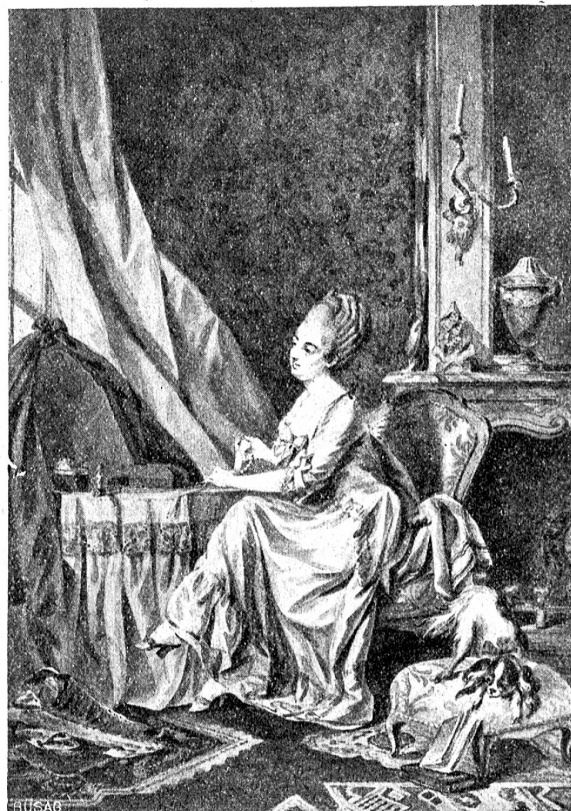
S. Freudenberg: Junge Frau in ihrem Boudoir. — 1768.

phäischen Professor Thomasius, der in seinem derzeit erst verdeutscheten Buche „De crimine magiæ“ all Teufelsbünd-