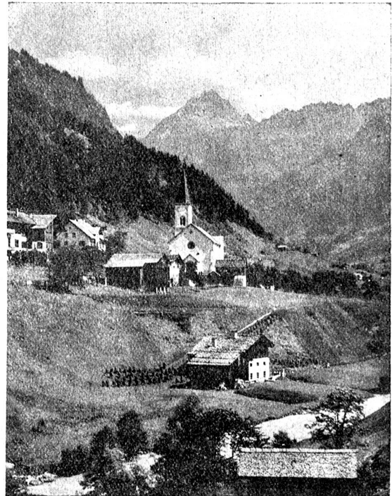
Gaschurn, schönes Bergdörfchen im obern Montafon (951 Meter), Ausgangspunkt von Hochtouren auf das Silvrettahorn und den Piz Buln; von hier aus geht das Schlappinerjoch hinüber ins Prätigau.

bar und ein kaiserlicher Vogt übernahm die Geschäfte. Das Land war willig, nur Feldkirch weigerte die Anerkennung (1415). Da rückte Zürich mit Chur und Werdenberg gegen