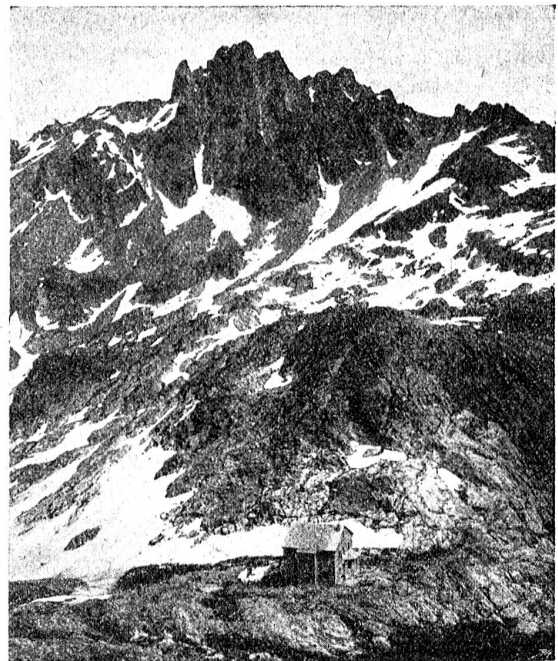
Reutlingerhütte und die Pflunspitzen (Vorarlberg).

können, zudem nach außen nie eine Einheit darstellend, ist das Land in stete Mitleidenschaft gezogen durch die Schweizerwirren nicht minder als durch die Kämpfe des Hauses Habsburg um den Schweizerbesitz. Als Rudolf von Habsburg mit St. Gallen in Fehde war, traten Bregenz und Feldkirch auf die Seite dieser Stadt, und als sie unterlag, hielt Vorarlberg zum Bischof von Chur, der im Verein mit Zürich den Kampf gegen Albert von Oesterreich fortsetzte. Bald darauf zerstörten die St. Galler, vereint mit dem Grafen von Bregenz, Miltätten, um dann im Auftrage des Kaisers Feldkirch zu belagern, welches die Reichsobrigkeit nicht anerkennen wollte.