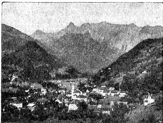
Schruns, Kurort im Montafon, mit Bludenz durch eine elektrische Bahn verbunden.

Ueber den Wirren, die das Konstanzer Konzil mit sich brachte, verloren die Habsburger alle Besitzungen in Vorarlberg, das Land wurde auf kurze Zeit wieder reichsunmittel-