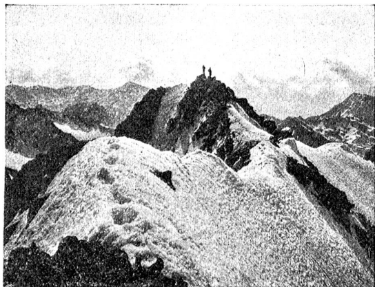
Der Gipfel des Piz Buin (3316 Meter), Grenzstein zwischen Vorarlberg, Schweiz und Tirol.

durch schauerhafte Gesetze vollendet. Schrecklich waren die Strafen gegen religiöse Vergehen. Den Verbrechern wurden die Hände abgeschnitten oder kopfabwärts an ein Brett ge-