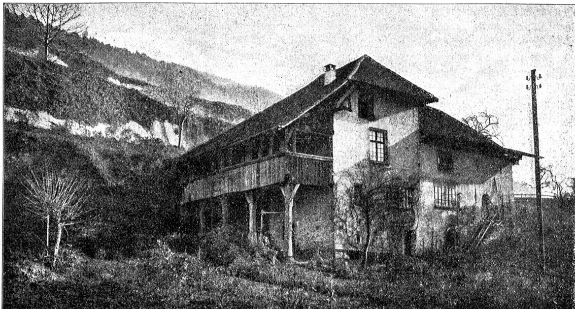
Das sogenannte „Heidenhaus“, ehemaliges Herbst- oder Rebhaus des Klosters Interlaken, in Oberhofen.

Endlich sagte ich: „Das war gar wunderbar, Renate; du bist gar sehr erschrocken!“