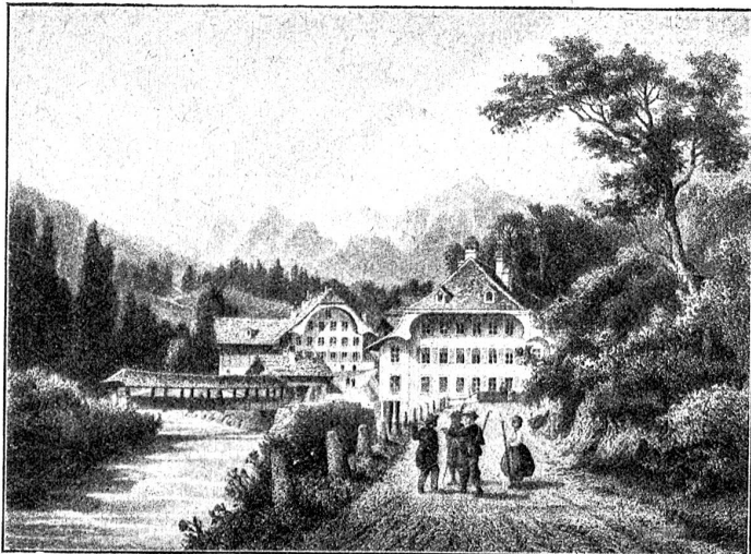
Weissenburg mit der alten Simmenbrücke.

eines Eies. Und auf dieser dünnen Schale, eine Hölle zu Füßen, die selbst ein Dante nicht annähernd zu schildern vermöchte, spaziert die Menschheit gemächlich herum. Wenn durch die Reaktion des Flüssigen das Feste dieses mal wieder einen Sprung kriegt, so dringen die Laven in Begleitung giftiger Gase aus den Tiefen herauf, ganze Länderschollen senken sich oder steigen empor, und das in seinen Niveauverhältnissen gestörte Meer dürfte ebenfalls furchtbare Verheerungen anrichten. Ist der Sprung sehr lang, wie der, aus dem die Cordilleren sich aufbüten und der fast von Pol zu Pol reicht, so kann die Flutwelle über beide Hemisphären rollen. Ob nicht die Sage der Sintflut, die sich fast bei allen Völkern findet, auf einen solchen Vorgang zurückzuführen ist? Soviel ist gewiß, daß die Geschichte der Erde noch nicht abgeschlossen sein dürfte — 5000 oder auch 10,000 Jahre Ruhe spielen da keine Rolle — und da sie nach den Rechnungen der Geologen schon 400 bis 500 Millionen Jahre seit ihrer Festwerdung alt sein soll, so wird wohl noch manches Millionchen dazukommen. Aber trotz dieser gewaltigen Zahlen ist Mutter Erde noch eine Dame in den besten Jahren. Die Falten und Runzeln, die sie allerdings schon aufweist und die wir als Berge und Täler ansprechen, haben so unendlich viel Zeit zu ihrer Bildung, bezw. Abtragung gebraucht, daß unser bisschen historische Zeitrechnung sie als immer vorhanden angesehen betrachtet.