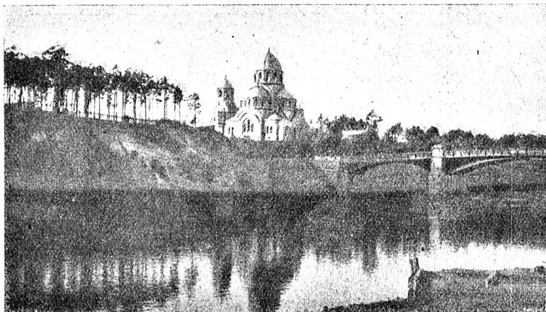
Russische „Alexander Newski“ Kapelle am Ufer der Wilija bei Wilnius.

Sie wurden nicht gehört. Der Fall von Petersburg aber veranlaßte schon hohe Wetten.