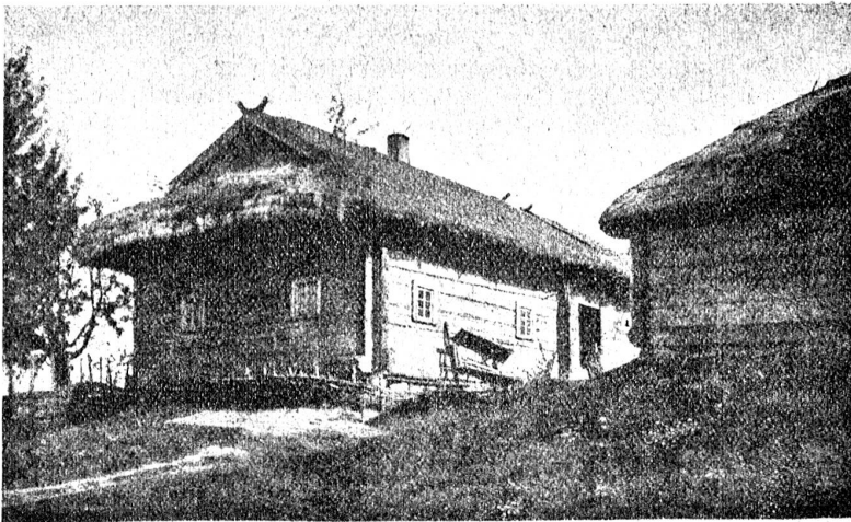
Hof in Südlitauen.

Inzwischen waren die Vorbereitungen zum Angriff auf Petersburg fertig geworden. Eine englische Flotte griff die roten Matrosensoviets von Kronstadt an. Die Truppen Judenitschs nahmen Jamburg und Krasnja Gorska und drangen bis in die Nähe von Peterhof vor. Die finnische Front in Karelien schien gleichfalls alarmiert zu sein. Die Reaktion frohlockte schon. In Kronstadt herrschte Verwirrung. Die Anzeichen von Aufruhr in Petersburg mehrten sich, der Terror zeichnete sich in schlimmen Gerüchten ab. Es hieß, die Stadt solle geräumt werden. Umsonst wiesen die Esthen in Reval auf die Unzulänglichkeit der Mittel im Heere Judenitschs hin. Umsonst ließen sie noch so oft durchblicken, sie würden helfen, wenn ihnen Kolttschak, der als Haupt der Reaktion angesprochen wurde, die Unabhängigkeit feierlich zusichere.