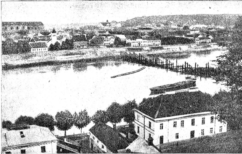
Kaunas (Kowno) mit dem Nemunas (Njemen).