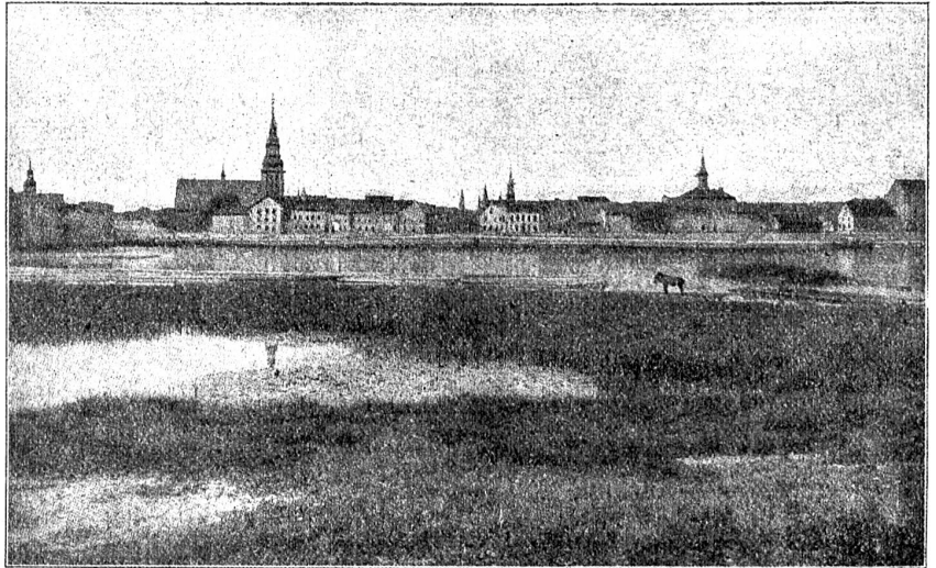
Silze (Cilsit) in Kleinlitauen.

Lettland ersuchte nun den heiligen Stuhl, er möchte in Riga einen Erzbischof einsetzen. Der esthnische Außenminister Postka erhielt von Bichon am 26. Juli die Zusicherung, daß Frankreich prinzipiell für die Unabhängigkeit Estlands sei. Am 16. August anerkannte als erste und einzige Macht Finnland die „Republik Esti“. Zugleich aber erwog man in Helsingfors die Idee eines baltischen Staatenbundes, der auch Litauen einschließen sollte. Die Letten und Esthen schafften im stillen weiter, um unter sich ins Reine zu kommen. Anfangs August ratifizierten die Konstituanten beider Republiken einen Vertrag, der über die Beziehungen beider Völker sagte, daß auf lettischem Boden sich keine Truppen aufhalten sollten, die Estland feindlich gesinnt seien. Das richtete sich gegen Deutsche so gut wie gegen die roten und