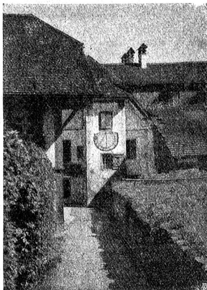
Alte Sonnenuhr auf dem Hofe zur Reubrücke bei Bern. Die Uhr befindet sich in einem malerischen Winkel an viel begangenen Fußweg und wurde jüngst durch Renovieren vor dem völligen Verfall bewahrt; sie hat Viertelstunden-Einteilung.

Das Thuner Schloß mit seinen vier Ecktürmen, das so stolz in die Lande hinausschaut und das Historische Museum beherbergt, wurde um das Jahr 1191 durch Herzog Berchtold V. von Zähringen nach dem Vorbild der zeitgenössischen französischen Schlösser errichtet, vielleicht auf römischen, vielleicht auf frühmittelalterlichen Ruinen. Nach dessen, im Jahre 1218 erfolgten Tode kamen Schloß und Herrschaft Thun durch Erbschaft an Graf Hartmann den Jüngern von Kyburg, der in zweiter Ehe mit Elisabeth von Chälons verheiratet war. Diese überlebte ihren im Jahre 1263 verstorbenen Gatten noch um 12 Jahre. Sie starb im Jahre 1275. Diese Elisabeth verließ der Stadt Thun im Jahre 1264 eine Handfeste oder Stadtordnung, die allerdings eine beinahe wörtliche Abschrift der Handveste der Stadt Freiburg im Uechtland ist, aber für Thun von solcher Bedeutung war, daß