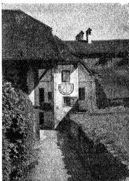
Alte Sonnenuhr auf dem Hofe zur Neubrücke bei Bern. Die Uhr befindet sich in einem malerischen Winkel an viel begangenen Fußweg und wurde jüngst durch Renovieren vor dem völligen Verfall bewahrt; sie hat Viertelstunden-Einteilung.

Das Thuner Schloß mit seinen vier Ecktürmen, das so stolz in die Lande hinausschaut und das Historische Museum beherbergt, wurde um das Jahr 1191 durch Herzog Berchtold V. von Zähringen nach dem Vorbild der zeitgenössischen französischen Schlösser errichtet, vielleicht auf römischen, vielleicht auf frühmittelalterlichen Ruinen. Nach dessen, im Jahre 1218 erfolgten Tode kamen Schloß und Herrschaft Thun durch Erbschaft an Graf Hartmann den Jüngern von Kyburg, der in zweiter Ehe mit Elisabeth von Châlons verheiratet war. Diese überlebte ihren im Jahre 1263 verstorbenen Gatten noch um 12 Jahre. Sie starb im Jahre 1275. Diese Elisabeth verließ der Stadt Thun im Jahre 1264 eine Handfeste oder Stadtordnung, die allerdings eine beinahe wörtliche Abschrift der Handveste der Stadt Freiburg im Uechtland ist, aber für Thun von solcher Bedeutung war, daß