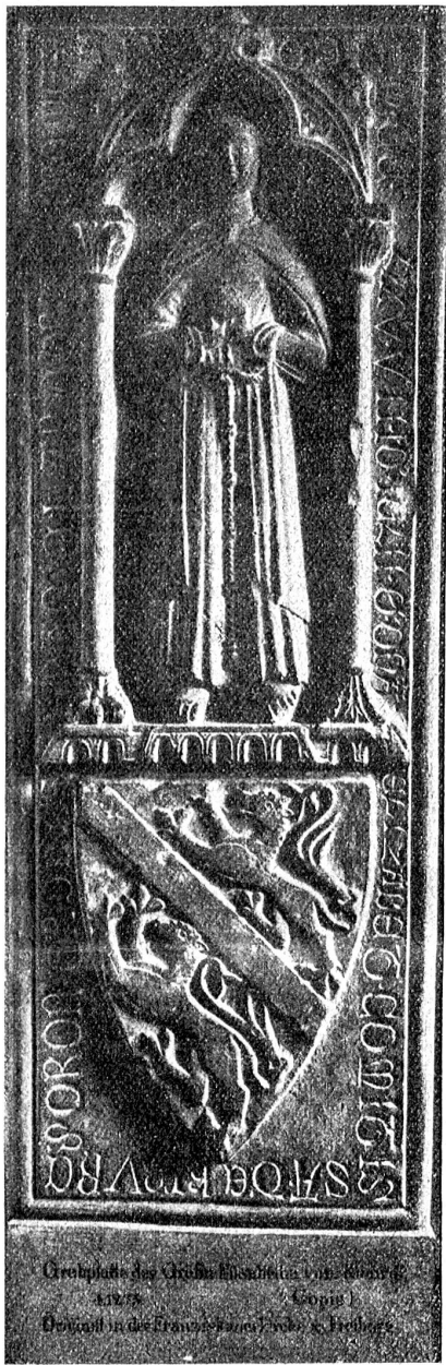
Grabplatte des Grafen Elisabeth von Burgund 1264 Original in der Franziskanerkirche in Freiburg

bei Nacht in eines andern Kraut oder Baumgarten gehen, sonst wird er für einen Dieb gehalten;