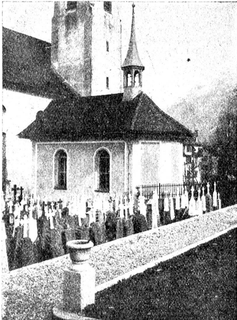
Grabsteinschmuck: Schlechtes Beispiel.

diesem Augenblick die Hand entgegenstrecken dürfte? Sehr herzlich kann ich es zwar nicht tun; denn ich habe selber den festen Stand im Leben noch nicht recht wieder gefunden.