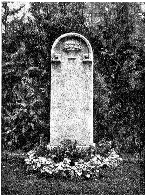
Grabzeichen aus Stein.

Wie mancher neue Friedhof in den letzten fünf Jahren entstanden sein mag auf unserem alten Europa? Wo der Tod nicht aus Granaten barst oder aus den Bleischlünden der Maschinengewehre prasselte, da ging er 1918 als ein unsichtbares, furchterregendes Gespenst umher und forderte